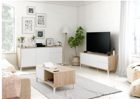
Table basse 2 niches L100 cm