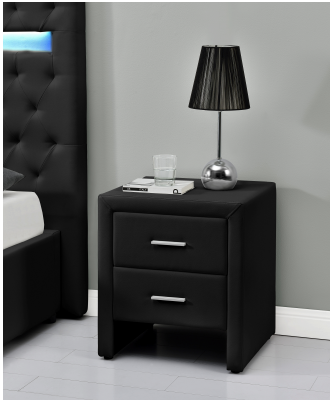
Table de chevet en simili