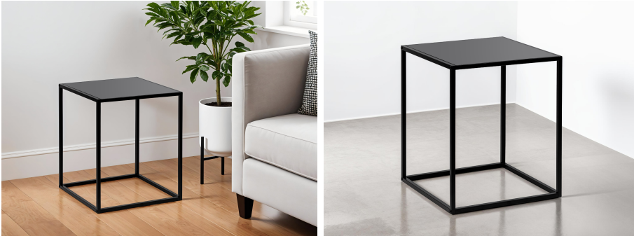
Table d'appoint en métal