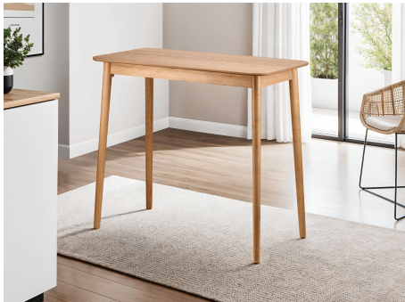
Table de bar en bois