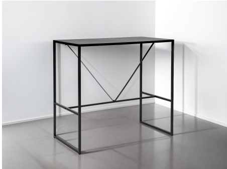
Table de bar en métal